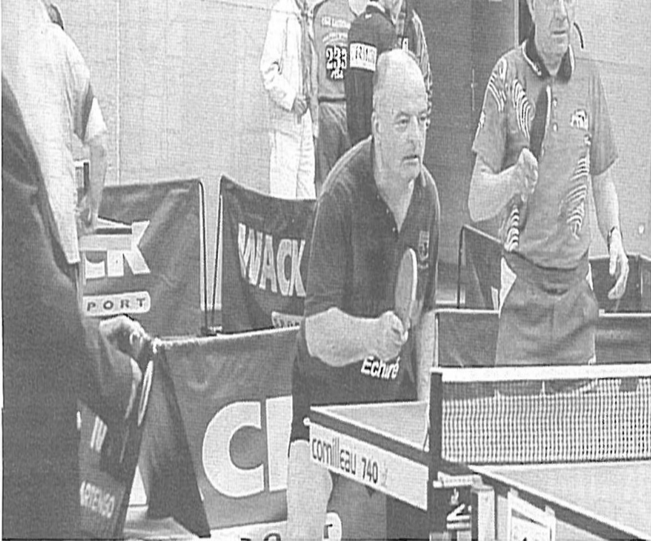
Avec l'enchanteur Merlin pour arbitre (à gauche), ce double était forcément magique. A l'image de ces coupes nationales.